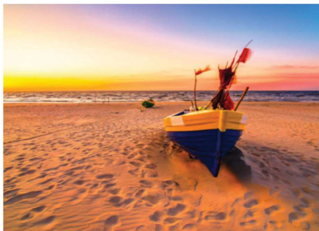
Korzystaj z pięknych plaż przez cały rok.

Czy wiesz, że w Kołobrzegu mieszka jedna z najbardziej znanych surrealistek w Polsce - Anastasiya Markovych ? Spotkać ją można na wielu artystycznych wydarzeniach Miasta a w naszym biurze na ul. Ratuszowej można napić się kawy podziwiając jej piękny obraz "Ozdobiona Snami". Do obrazów powstają też opowiadania, które można przeczytać na stronie Artystki - www.amarkovych.art