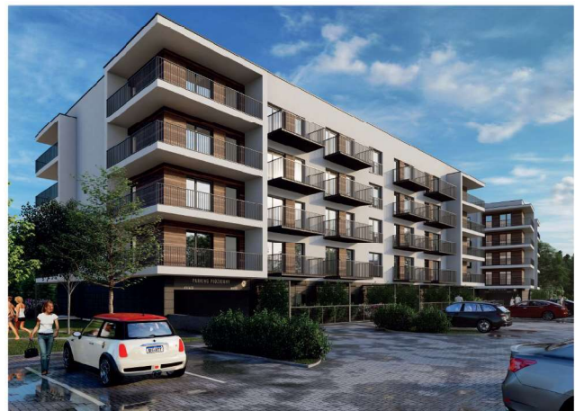
Wizualizacja osiedla "MIESZKANIA NOVA BALTICA".

Odwiedź stronę www.remaxsunset.pl i sprawdź pozostałe mieszkania dostępne w naszej ofercie.