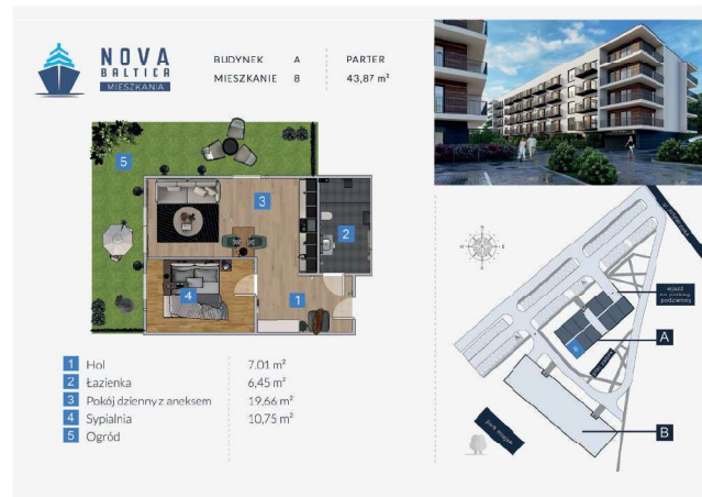
Mieszkanie 2-pokojowe nr 8, Budynek A, parter z ogródkiem.

Możliwość dokupienia miejsca postojowego w hali garażowej w cenie 48 000 zł brutto lub miejsca zewnętrznego w cenie 20 000 zł brutto .