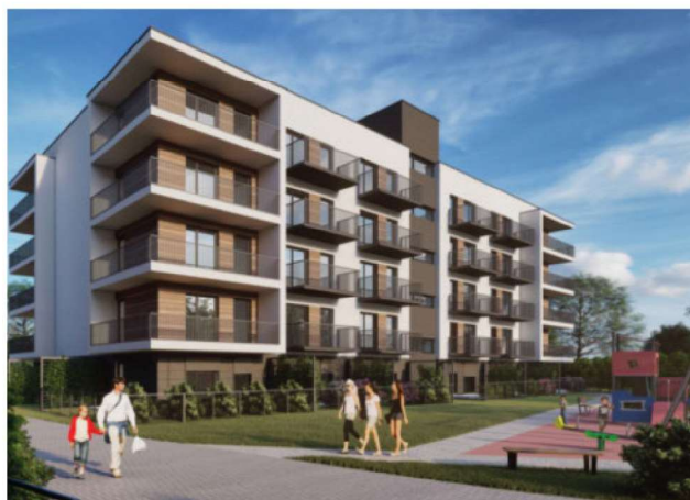
Zamieszkać na Osiedlu Nova Baltica w Kołobrzegu.