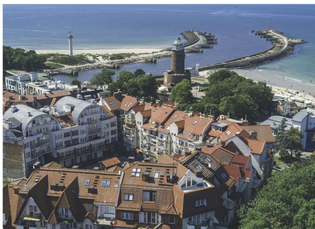
Kołobrzeg wygrywa w rankingu na najlepsze miasto do życia w Polsce.