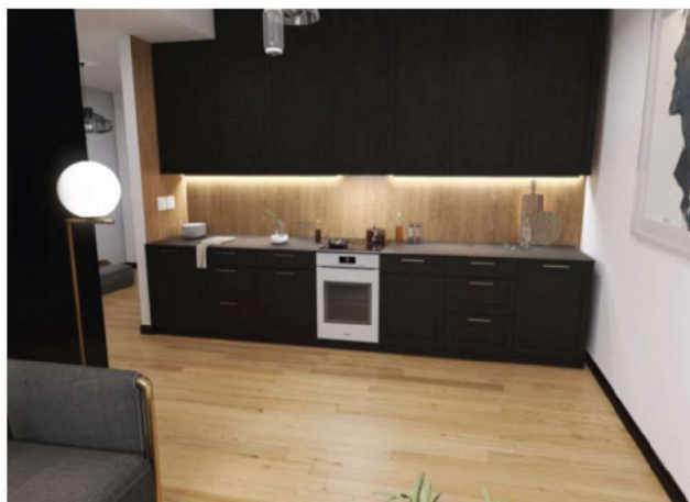
Już dziś pomyśl o wymarzonej kuchni.