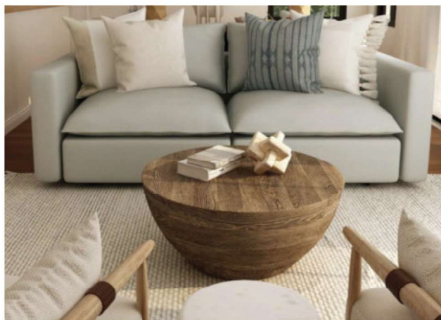
Zaprojektuj najlepszą przestrzeń dla swojej Rodziny.

Kołobrzeg to jedno z takich miejsc w Polsce, które gwarantuje w pełni satysfakcjonującą jakość życia, w wielu aspektach codziennego funkcjonowania. To piękne i powszechnie lubiane miasto niezmiennie przyciąga walorami krajobrazowymi i prozdrowotną aurą - zarówno turystów, jak i wszystkich spragnionych wypoczynku w bliskim otoczeniu morza. Jako jedno z największych miast uzdrowiskowych oferuje leczniczy klimat i powietrze nasycone korzystnym dla organizmu jodem, co docenią nie tylko osoby preferujące rozmaite formy aktywności na świeżym powietrzu.